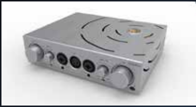
ifi iCan Pro